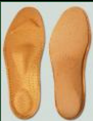
052 | VLOŽKY ORTOPEDICKÉ S+V