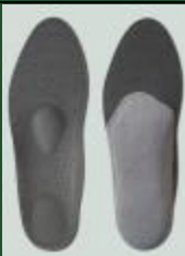
042 | VLOŽKY SKELET EVA