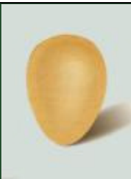
018 | SRDÍČKA SAMOLEPICÍ - KAPKA