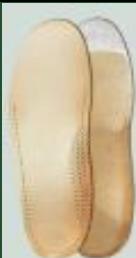
054 | ORTOPEDICKÉ VLOŽKY S+V